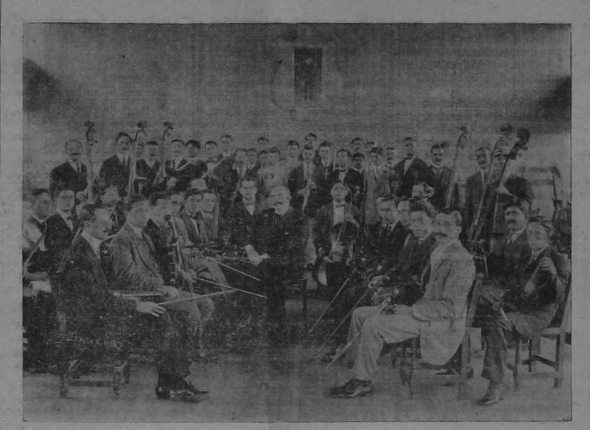
Instantánea de los miembros de la Asociación Musical tomada ayer por uno de nuestros fotógrafos, durante el ensayo general del gran concierto de esta noche.

como hoy lo estamos de la banda militar de esta capital. El programa del concierto es de lo mejor. Tanto la abertura de "El Rey lo dijo", de Os Delli-